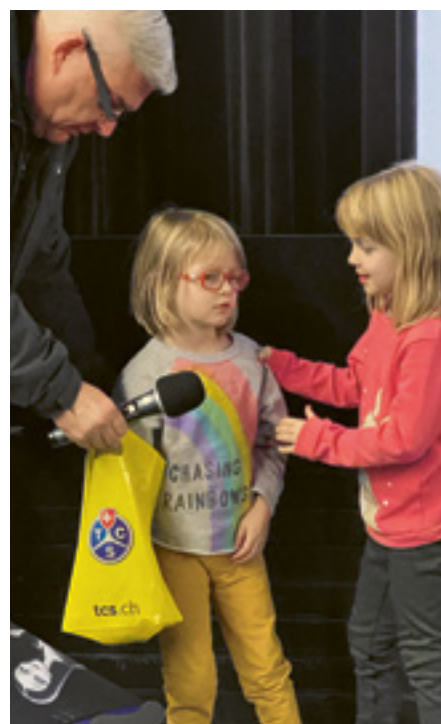
Die beiden Glücksfeen bei der Arbeit