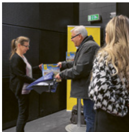
Eine glückliche Gewinnerin

Der Kinospass war definitiv ein grosser Spass – es war ein rundum gelungener Anlass. Bei Klein und Gross wurden die Lachmuskeln stark strapaziert. Dank der grosszügigen Geste des jubilierenden TCS konnten wir viele Familien glücklich machen und ihnen einen lustigen Start in den Sonntag bescheren.